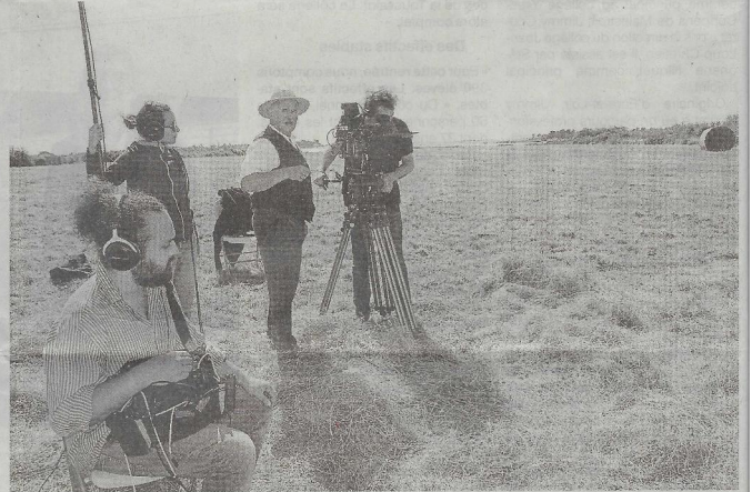
Le film « Histoires de Breizh » est en cours de tournage à Damgan. Il est réalisé par François Le Roux, également acteur, ici en costume du XIX e siècle.