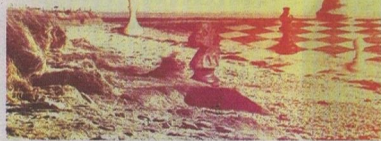
La pré-affiche du film Histoire de Breizh , que François Le Roux tournera en Bretagne sur août et septembre 2024. F. Le Roux