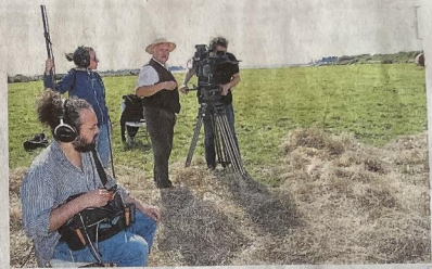
Le film "Histoires de Breizh" est en cours de tournage à Damgan. Il est réalisé par François Le Roux, également acteur, ici en costume XIXe.