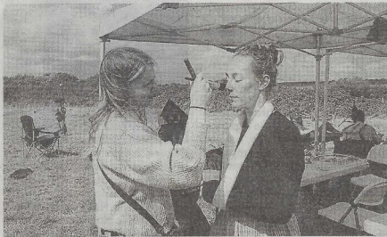
Séance maquillage entre deux scènes.